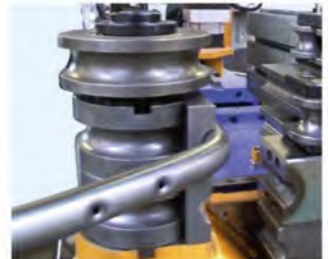
打孔裝置 Hole punching