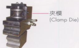
夾模 (Clamp Die)