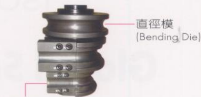
直徑模 (Bending Die)