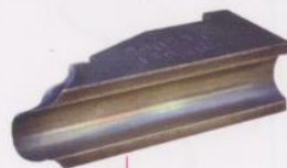
後導模 (Wiper Die)