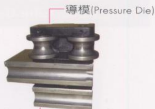
導模 (Pressure Die)