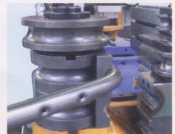
打孔裝置 Hole punching