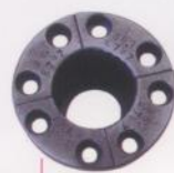
束頭 (Tube Collet)